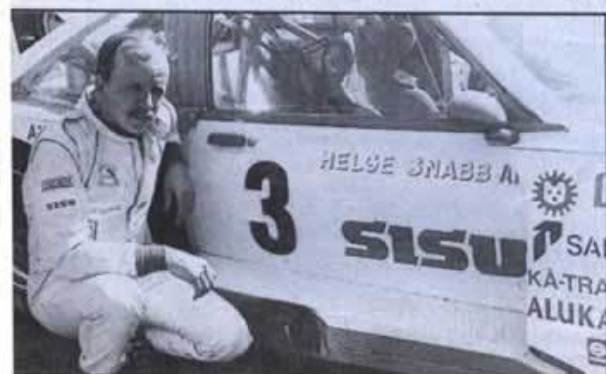
Helge Snabb ei onnistunut Ahvenistolla vaikka pakäännet oli-vaikin oikeat. Kaasuvivusto jätti ilman PM-pinoja.

Ja SM-sarja rata-autoilun osalta jatkuu toukokuun lopulla Veteissä Memoran moottoriradalla.